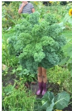
Boerenkool met benen