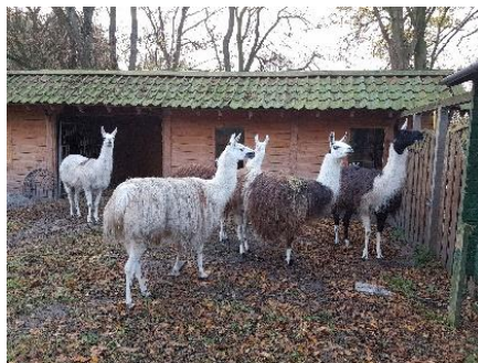
De voltallige groep

Eind dit jaar hebben we dankzij een donatie een jonge Poll Dorset schapen ram aan kunnen kopen en inmiddels zijn de 2 Poll Dorset schapen gedekt. Ook hebben we een bonte Toggenburger bok gekocht. Deze heeft inmiddels alle 4 de (kruising) Toggenburger geiten gedekt. Van Sprookjeswonderland is een Nubische bok geleend. Deze zal zijn werk nog moeten doen. Er is gekozen voor een iets later dek-tijdstip dan de meeste boeren doen. Zo zorgen we ervoor, dat er in de zomervakantie nog steeds leuke lammetjes te zien zullen zijn voor de bezoekers.