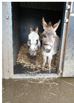
2 nieuwe mini ezeltjes