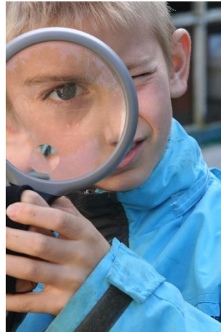
Onder het vergrootglas