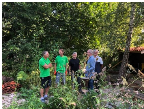
Tuinvrijwilligers in overleg