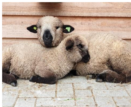
2 jonge Hampshire down schapen lammetjes