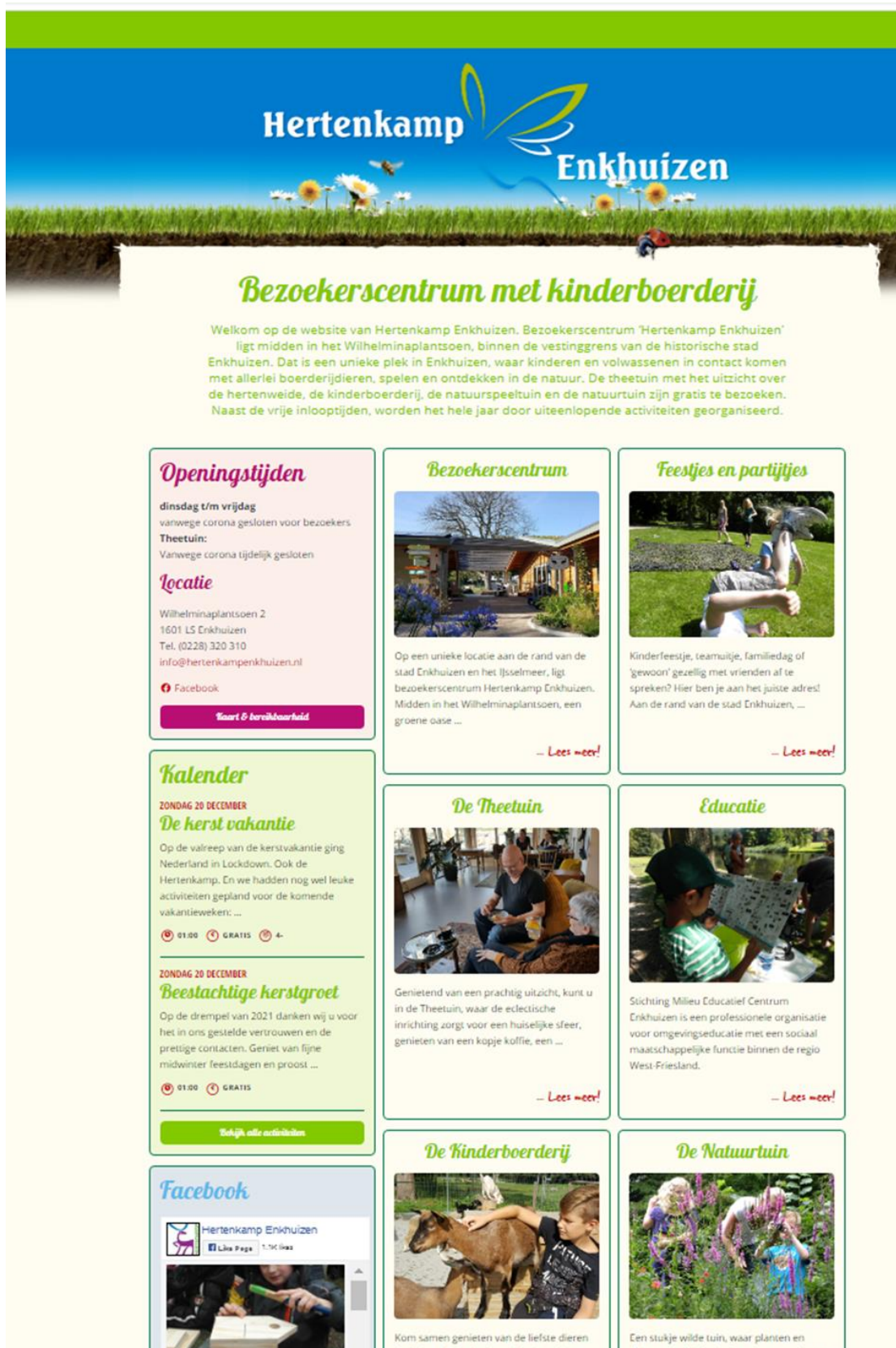
Afb: de vernieuwde website.